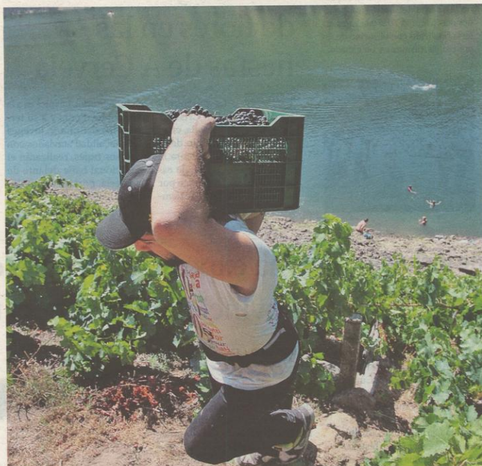
Las primeras uvas de la campaña entraron ayer en la bodega que elabora el vino Lucenza. ROI FERNÁNDEZ

La vendimia del 2011, también de las más madrugadoras, la abrieron las bodegas Val de Quiroga y Algueira un día 1 de septiembre, con la recogida de uvas de godello y merenzao, variedad tinta esta última caracterizada por su maduración precoz. Val de Qui-