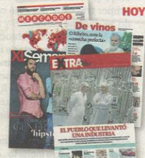
EXTRAVOZ O Porriño, el pueblo que logró levantar su propio y singular tejido empresarial

25 operadores están homologados y se dedican a la fotografía, vigilancia y arquitectura